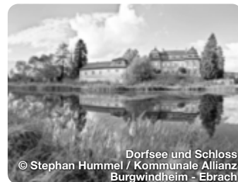
Dorfsee und Schloss

Alles über Blue Jeans. Levi Strauss, der Vater der Blue Jeans. Levi Strauss kam aus dem kleinen fränkischen Ort Buttenheim. Geboren wurde Löb Strauss, wie Levi Strauss ursprünglich hieß, am 26. Februar 1929. Marktstr. 33, Buttenheim