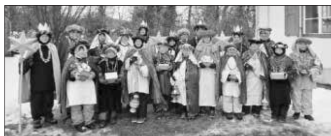
Sternsinger Aufkirch, Blonhofen und Helmishofen: