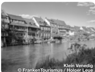
Klein Venedig