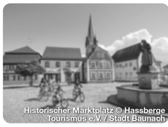
Historischer Marktplatz