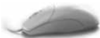
Ein besonderer Service für unsere Bürger

Des Weiteren stehen noch weitere Formulare über den Formularservice zur Verfügung.