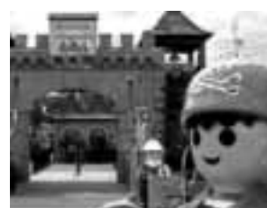
Zirndorf Playmobil FunPark treffpunktdeutschland.de/zirndorf