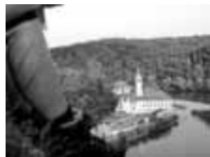
Kelheim Kloster Weltenburg