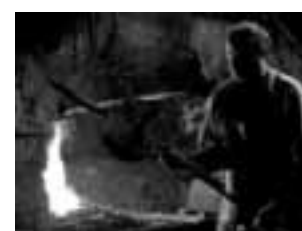
Bad Hindelang Hammerschmieden treffpunktdeutschland.de/bad-hindelang